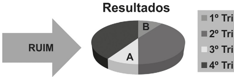
FIGURA 8.1 Gráfico que distorce a realidade: A e B são iguais, mas A parece maior.