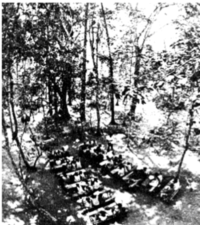
Nas "zonas libertadas" durante as lutas contra o colonialismo, uma escola na Guiné-Bissau.

A educação existe em toda parte e faz parte dela existir entre opostos. O que vimos juntos, leitor, acontecer na Grécia repete-se mil vezes em mil tempos de outros mundos sociais. Entre sujeitos igualados pelo trabalho comum e o saber comunitário, também a educação pertence do mesmo modo a todos e, se existe diferente para alguém, é para especializar, para o uso de todos, o seu saber e o seu trabalho. Mais do que poder , portanto, ela atribui compromissos entre as pessoas.