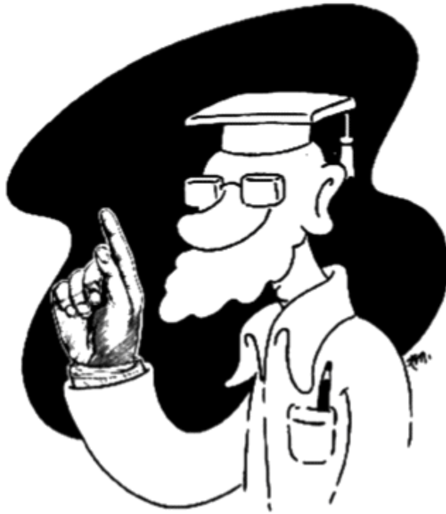
A autoridade do mestre na educação dita democrática.

Então, o que parece inacreditável faz parte da própria lógica do modo como a educação existe na sociedade desigual. Quando pensada como uma “filosofia” ou uma “política de educação”, ela se apresenta juridicamente como um bem de todos, de que o Estado assume a responsabilidade da distribuição em nome de todos. Mas sequer as pessoas a quem a educação serve, em princípio, são de algum modo consultadas sobre como ela deveria ser. A educação que chega à favela chega pronta na escola, no livro e na lição. Os pais favelados dos alunos são convocados a matricular os seus filhos como se aquilo fosse um posto de recrutamento. Não são convocados, por exemplo, a debaterem com os professores como eles pensam que a escola da favela poderia ser uma verdadeira agência de serviços à sua gente. Mesmo que fossem, as suas ideias por certo não sairiam do caderno de anotações da diretoria. Mas não são só os pais e as crianças faveladas os que não têm direitos de pensar na educação da favela. Mesmo os cidadãos