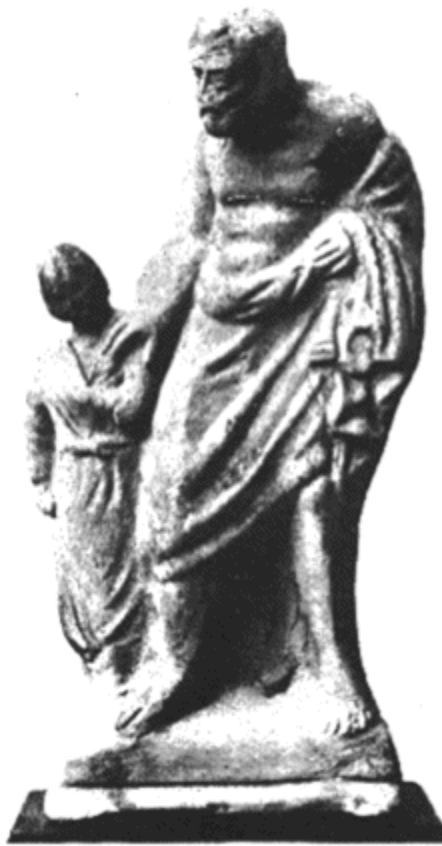
Pequenas imagens gregas de terracota retratam o escravo pedagogo conduzindo a criança para a escola.

Xenofonte, historiador, poeta, filósofo e militar grego, criticaria essa concepção quase dois séculos depois: