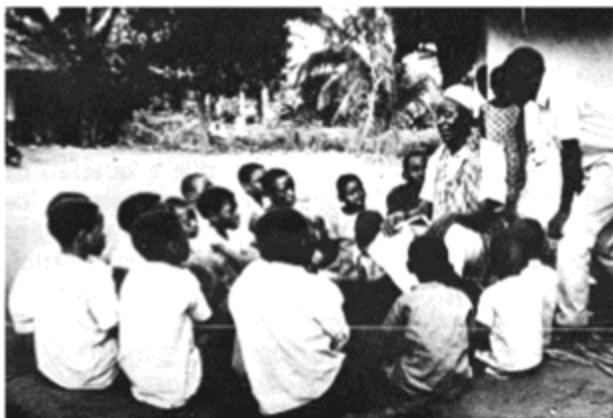
Na aldeia africana, o “velho” ensina às crianças o saber da tribo.

damos o nome de educação. Na educação, como o homem a pratica, atua a mesma força vital, criadora e plástica, que espontaneamente impele todas as espécies vivas à conservação e à propagação de seu tipo. É nela, porém, que essa força atinge o seu mais alto grau de intensidade, através do esforço consciente do conhecimento e da vontade, dirigida para a consecução de um fim.”